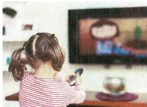
Pas de télévision avant trois ans.

Une trop grande exposition aux écrans en bas âge pourrait nuire :