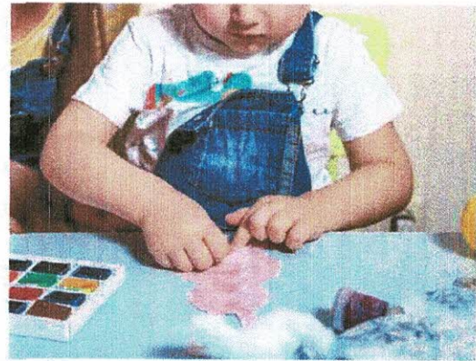
Proposer des alternatives aux écrans.

lui son programme, parler avec lui du contenu, observer ses réactions.